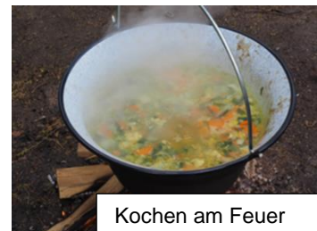
Kochen am Feuer

Für alle Veranstaltungen gilt: Die Lehrkräfte wählen, möglichst mit den Kindern zusammen, die Inhalte und die methodischen Schwerpunkte. Alle Inhalte haben Bezüge zum Bildungsplan. Hier drei Beispiele mit Stichworten zu möglichen Inhalten: