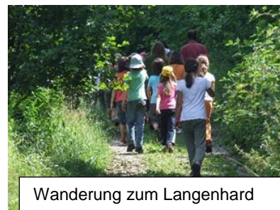
Wanderung zum Langenhard